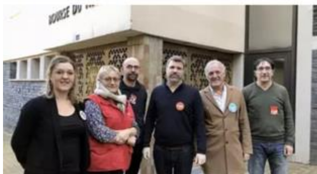
Angers, vendredi 19 janvier 2024. Les secrétaires départementaux des différents syndicats affichent leur unité.

Intersyndicale de l'Union départementale du Maine et Loire