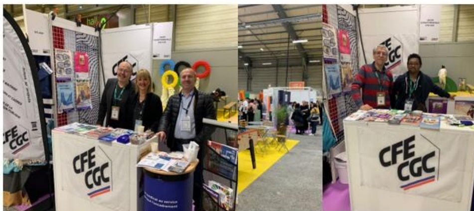
La CFE-CGC présente au Salon CSE les 14 et 15 mars à NANTES